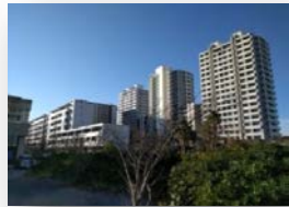
直線的なシルエットが都会的