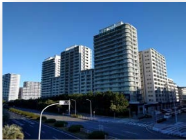
マリンテイストな色合いが爽やか