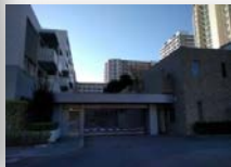
ホテルのような駐車場