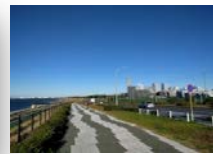
海沿いのランニングコース